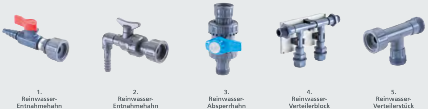
1. Reinwasser- Entnahmehahn